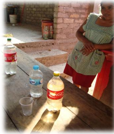
Ilustración 30. Venta de mezcal a orilla de carretera, Omeapa.