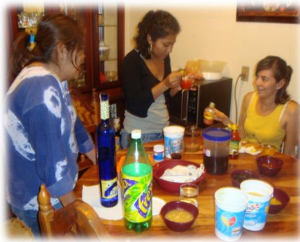
Ilustración 37. Elaboración de chamorrachas, Chilpancingo.