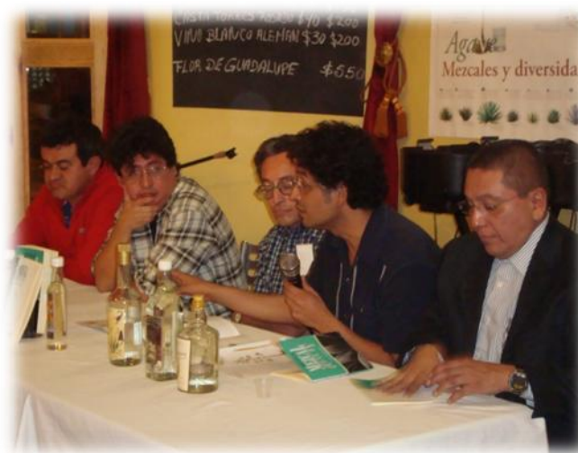
Ilustración 35. Presentación de libro "Breve guía del mezcal" y degustación de mezcal, D.F.