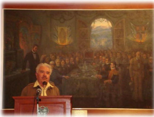
Ilustración 43. Tulio R. Estrada, homenaje a Héctor Cárdenas, Chilpancingo.