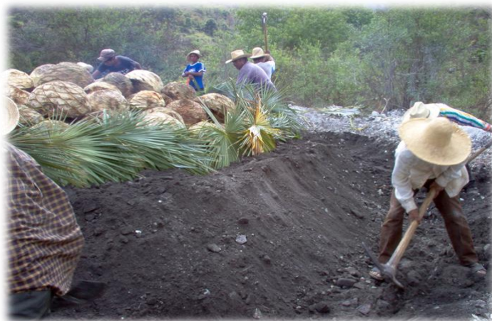
Ilustración 23. Cocimiento de maguey en horno de tierra, Coaxtlahuacán. (Fot. R.D.R. 2006)