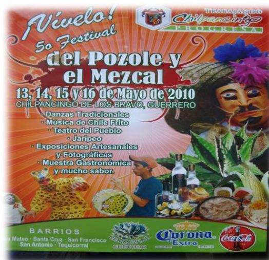
Ilustración 34. Propaganda Festival del Pozole y el Mezcal, Chilpancingo.