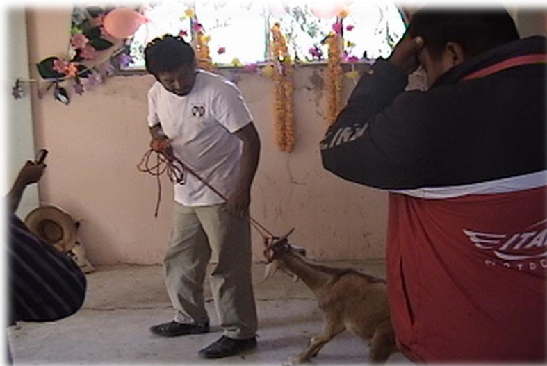
Ilustración 9. Presentacion del chivo al altar para su sacrificio, cerro Xomizlo.