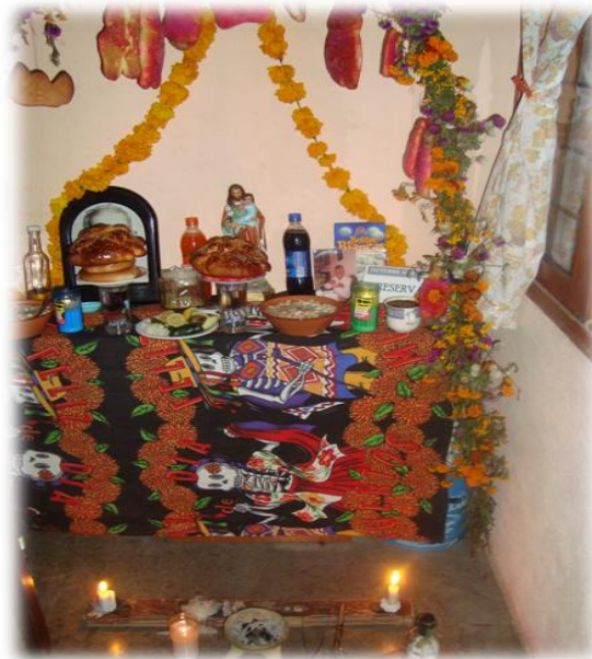
Ilustración 20. Mezcal en ofrenda, día de muertos, Chilpancingo.