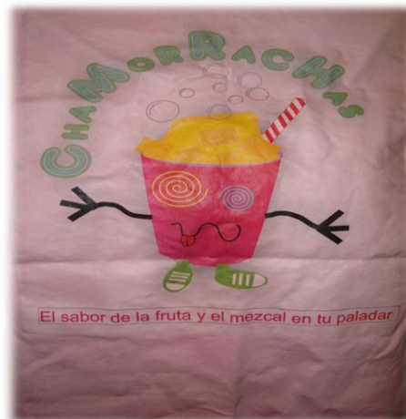
Ilustración 38. Eslogan para chamorrachas, Chilpancingo.