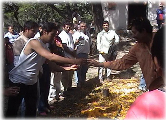
Ilustración 10. Intercambiando mezcal para ofrenda a los vientos, cerro Xomizlo