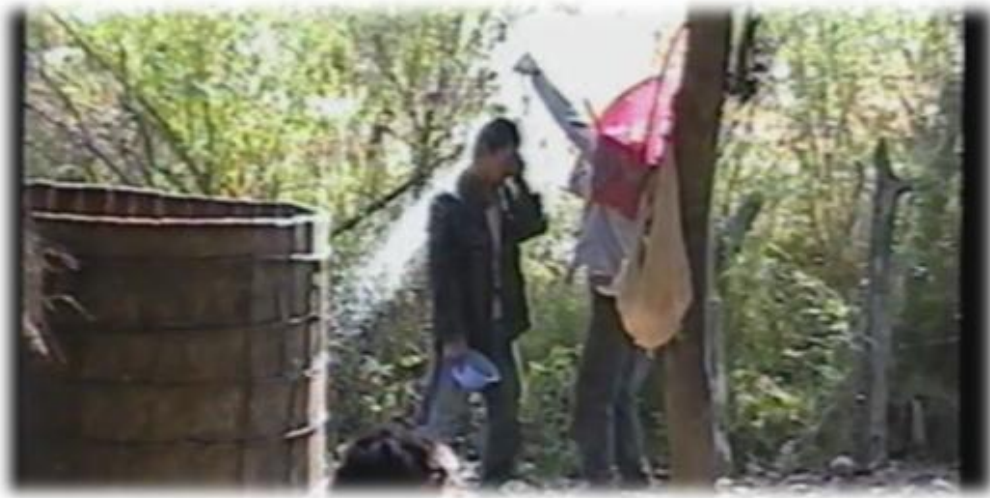
Ilustración 7. Baño con colas de mezcal –uso curativo –, Coaxtlahuacán.