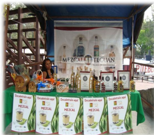
Ilustración 32. Venta de mezcal certificado, Chilpancingo.