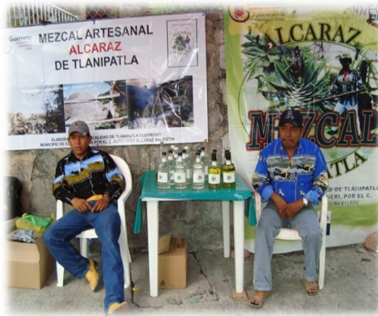
Ilustración 31. Venta de mezcal artesanal en proceso de certificación, Chilpancingo.