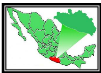
Mapa 1. Regiones de Guerrero. 15

De acuerdo al Censo de Población y Vivienda del INEGI 2010 (datos preliminares), Chilpancingo de los Bravo tiene un total de 240 727 habitantes, Llanos de Tepoxtepec un total de 149 habitantes 13 , Coaxtlahuacán un total de 616 habitantes 14 y Tixtla de Guerrero un total de 40 100 habitantes.