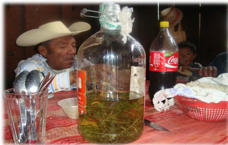
Ilustración 3. Mezcal con Damiana, Llanos de Tepoxtepec.