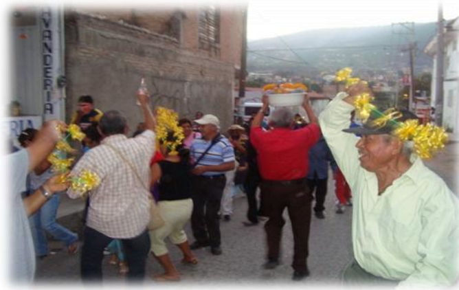
Ilustración 16. Mezcal en el huentli para padrinos de boda, Chilpancingo.