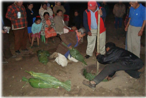
Ilustración 21. Horneado de los bolím, San Francisco Chontla Ver.