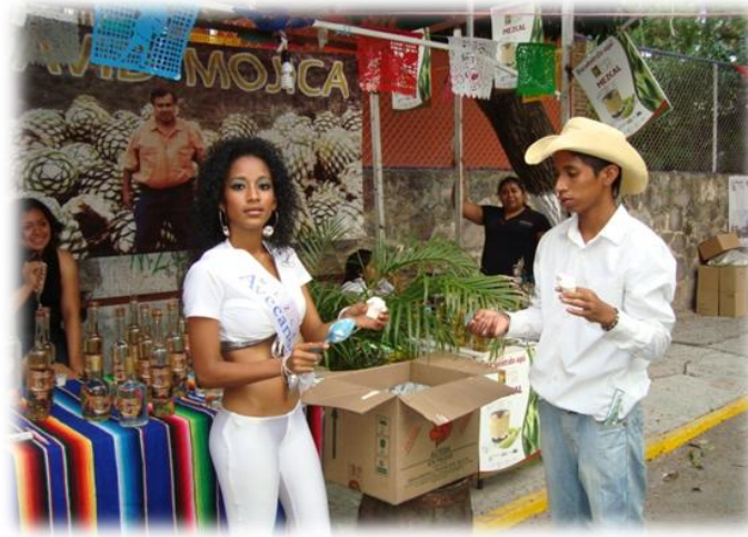
Ilustración 36. Nieve con mezcal, Chilpancingo. (Fot. R.D.R. 2010)