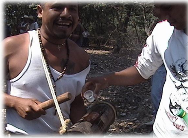
Ilustración 13. Mezcal para el teponaxtle "para que toque bien", cerro Xomizlo