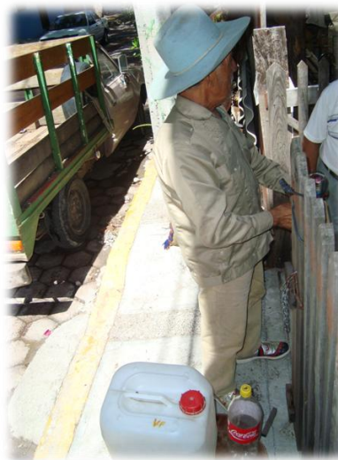
Ilustración 29. Vendedor de mezcal ambulante, Chilpancingo.