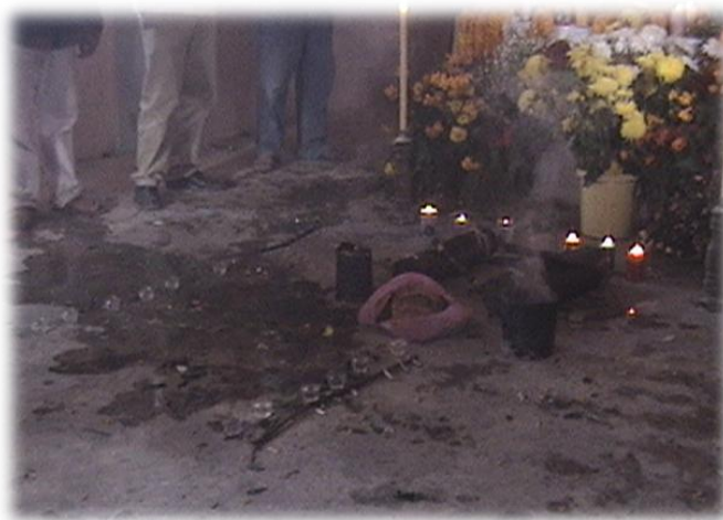
Ilustración 11. Ofrenda a la tierra; mezcal, cigarrros, pan, copal. Cerro Xomizlo