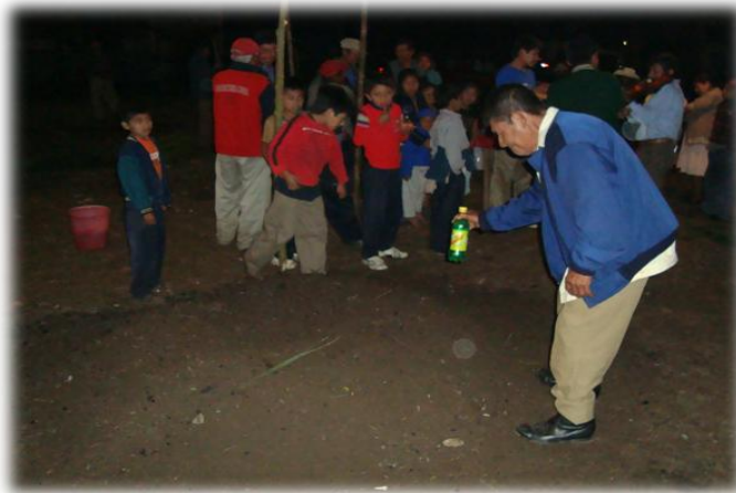
Ilustración 22. Rociado de aguardiente para buen cocimiento de los bolím, San Francisco Chontla Ver.