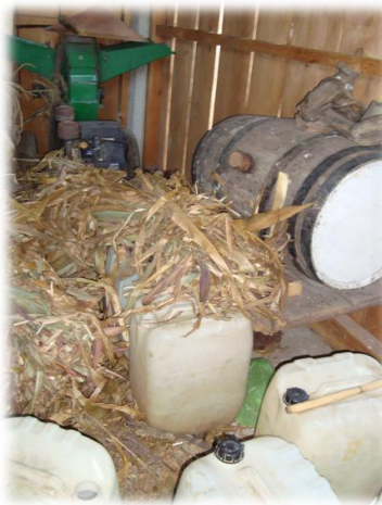
Ilustración 28. Almacen de mezcal, Llanos de Tepoxtepec. (Fot. R.D.R. 2009)