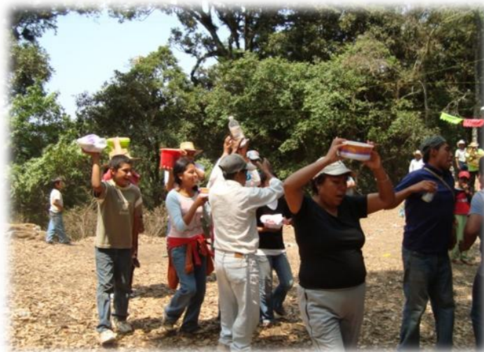
Ilustración 15. Mezcal en el huentli, Coaxtlahuacán