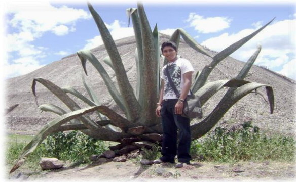
Ilustración 18. Teotihuacán y maguey, Estado de México.