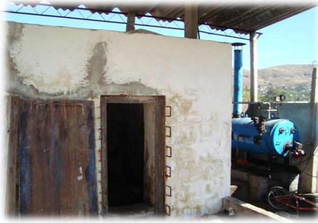
Ilustración 24. Cocimiento de maguey en caldera, Mazatlán.