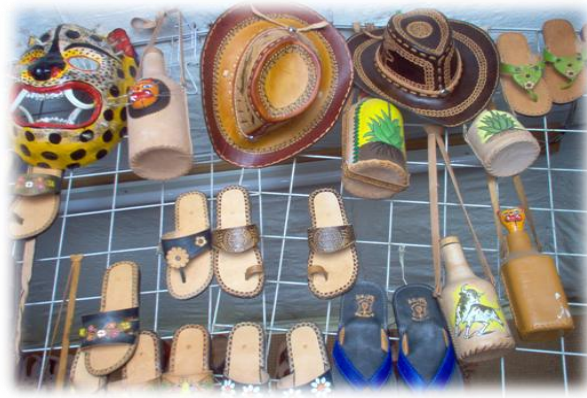
Ilustración 27. Botellas para mezcal, Tixtla.