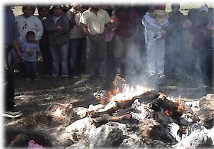
Ilustración 12. Chivo ofrendado al fuego, cerro Xomizlo. (Fot. R.D.R. 2009)