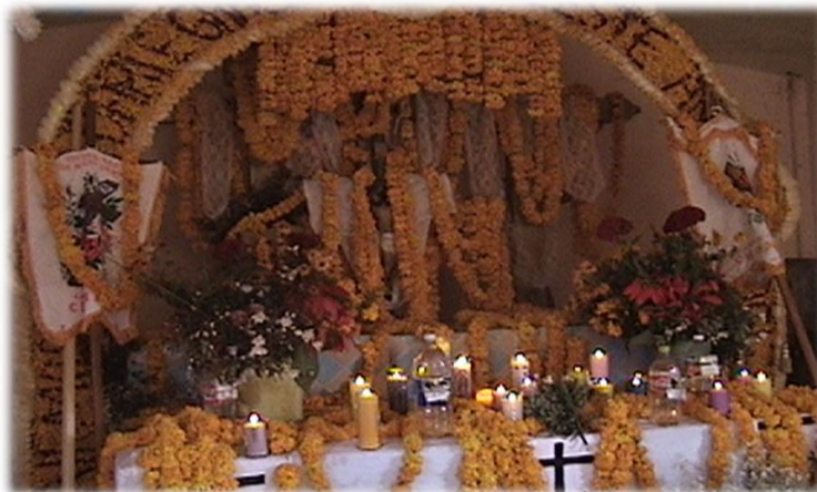
Ilustración 14. Mezcal en ofrenda, al fondo arco hecho con hojas de maguey "cucharillo" cerro Xomizlo.