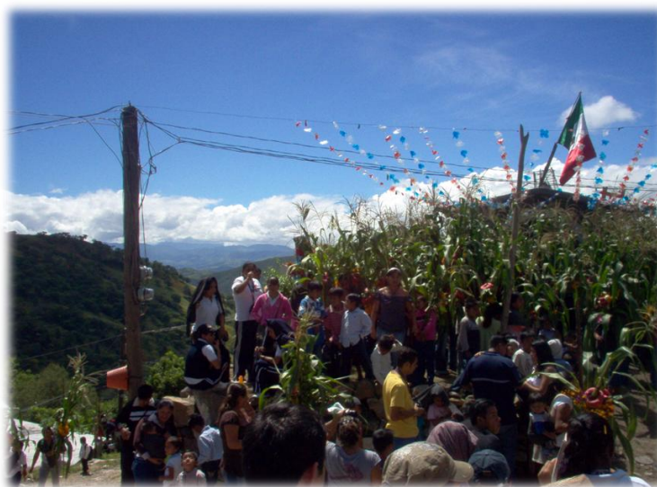
Ilustración 6. Baile de la milpa, Chiepetepec. (Fot. R.D.R. 2009)