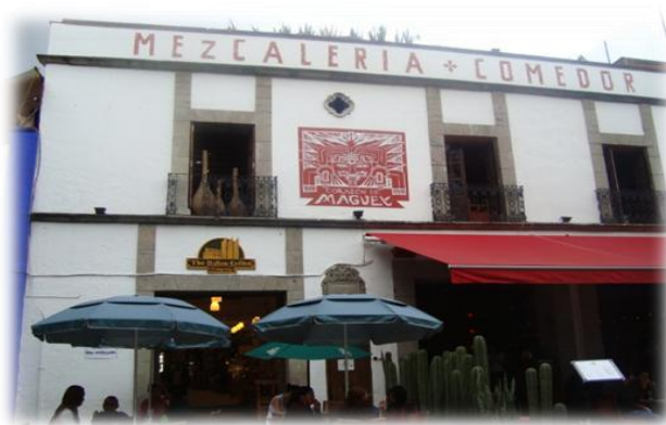
Ilustración 33. Mezcaleria en Coyoacán, D.F.