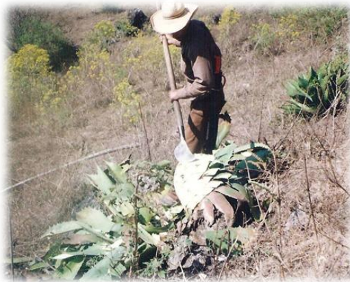
Ilustración 2. Labrando maguey, Coaxtlahuacán.