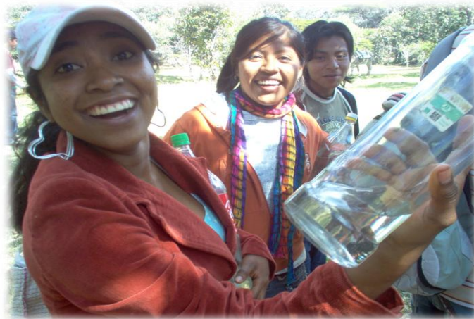
Ilustración 5. Mezcal con jumilín, cerro Xomizlo