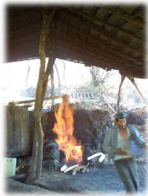
Ilustración 17. Trago de mezcal al amigo -diablo-, Coaxtlahuacán.