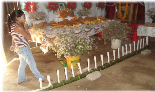
Ilustración 19. Ofrenda día de muertos, calehual de maguey con velas, Llanos de Tepoxtepec.