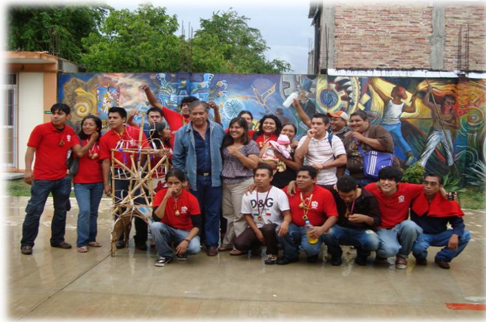
Ilustración 4. Quema en U.A. Antropología Social U.A.G.