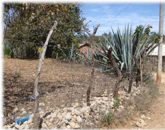
Ilustración 26. Cerco con maguey, Omeapa.