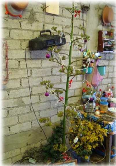
Ilustración 25. Calehual de maguey como arbol de navidad, Coaxtlahuacán.