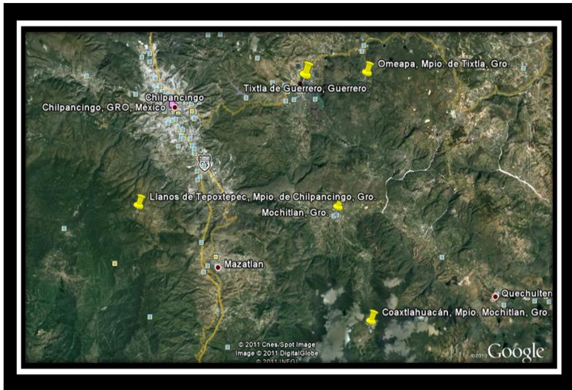
Mapa 3. Segmento de la Región Centro. Chilpancingo y puntos amarillos; localidades en donde se realizó trabajo de campo