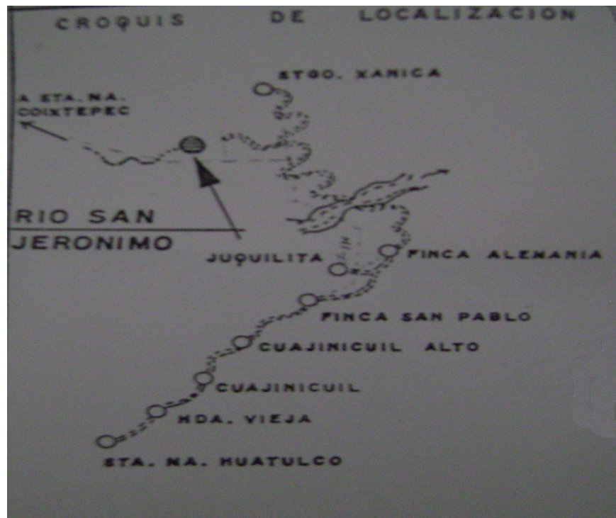
Archivo municipal, Santiago Xanica.

personas, 371 hombres y 375 mujeres (Inegi,2005).